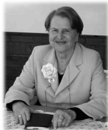
DRA. ZILDA ARNS NEUMAN, FUNDADORA DE LA "PASTORAL DA CRIANCA" DE BRASIL