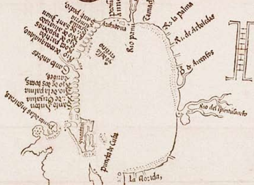
IMAGEN: Primer plano publicado de la ciudad azteca de Tenochtitlán (actual Ciudad de México), tomado de "La Espléndida narración de Fernando Cortés acerca de la Nueva España del mar y el océano transmitida al más sagrado e invencible, siempre augusto Carlos, Emperador de los romanos, Rey de los españoles en el año del Señor 1520 [...]". Hernán Cortés, 1524. Biblioteca John Carter Brown.

Quislibet punctus magnus continet leucas diode cum eò dimidia, ita q; duo magni puncti continent viginti quinque leucas, Cōtinet autē leuca quatuor Italica miliaria, ita q; omnes puncti qui hic capiuntur